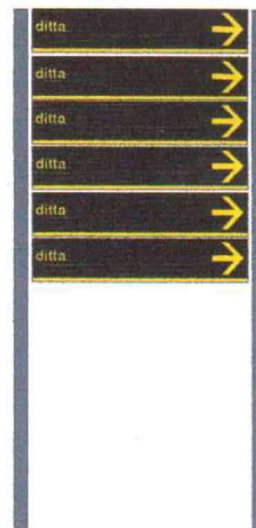
ALLEGATO A.3 – Figura 3

Si prevede un n.ro mass. di 5 preinsegne per supporto