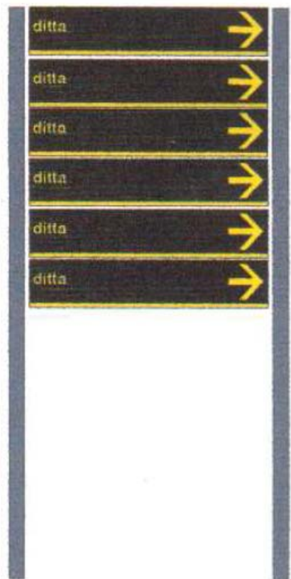
ALLEGATO A.1 – Figura 1